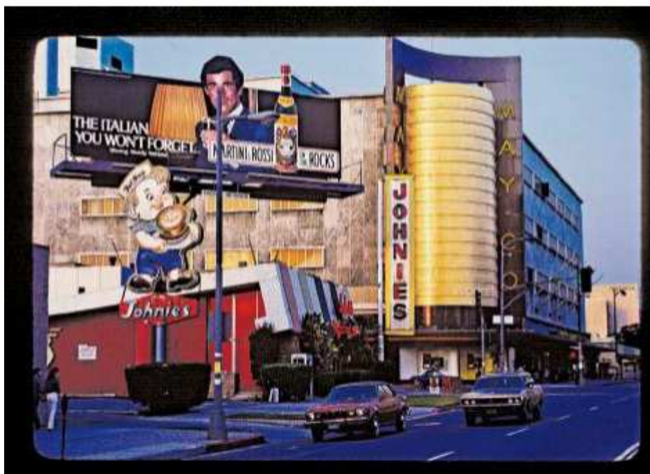
Los Angeles 1981: Dieses und weitere Bilder von Willy Spiller sind in der Photobastei zu sehen.