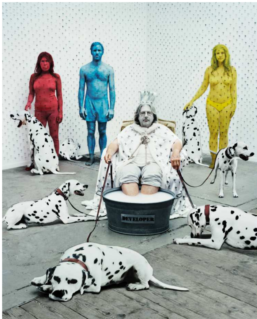
Aus der Serie: 31 Days, Ways, Minds - Zurich