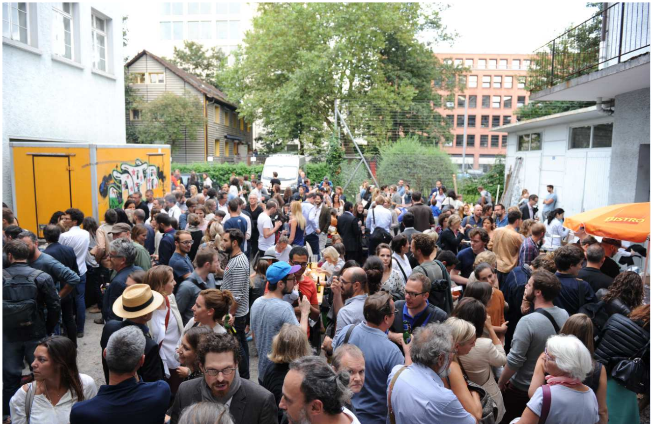
Blick in den Innenhof anlässlich der Eröffnungsparty