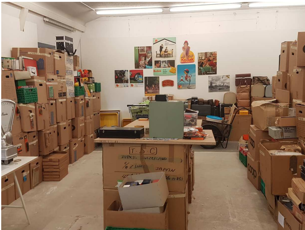
Manifesta 11 - Foto Ernst @ Photobastei