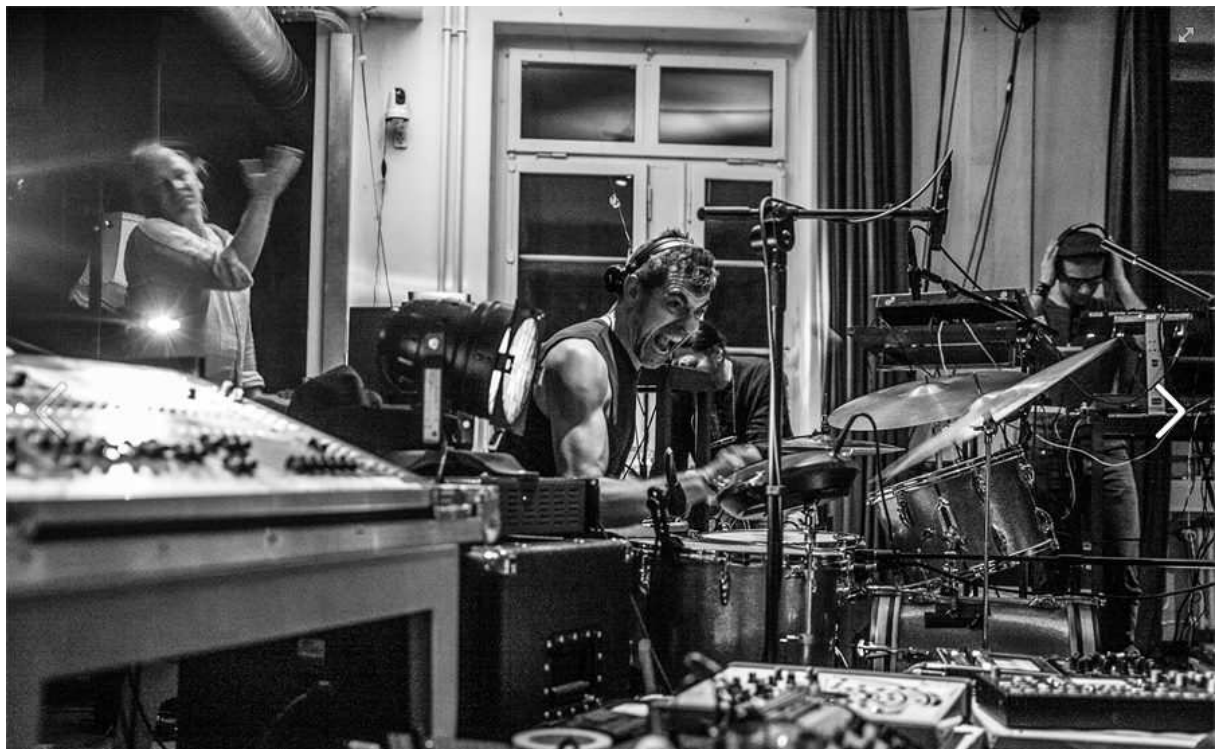
superterz @ Photobastei, (c) Tatjana Rüeegsegger